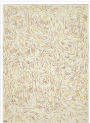
Henri Michaux, Dessin de

A l'occasion d'un temps libre, d'une balade matinale ou d'une sortie de week-end, les promeneurs sont conviés à déambuler entre la rue des Beaux-Arts et la rue de Seine, poumon artistique de la rive gauche. En avril, les galeries du quartier de Saint-Germain-des-Prés s'étaient déjà mobilisées autour d'une initiative nouvelle : offrir aux badauds et passants une exposition malgré la fermeture des espaces culturels et artistiques. Intitulée « A visage découvert », l'évènement prenait place dans les vitrines de leurs galeries. L'enjeu était de permettre aux amateurs d'art de pouvoir apprécier visuellement les œuvres, en taille réelle et de faire perdurer un lien avec la clientèle et les passants.