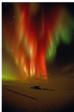
Philippe Cabaret, Tirage photo aluminium , 2000, 12 x 80 cm

Dès le mois d'avril, le succès était notoire : vingt galeries avaient participé à ce projet et les promeneurs avaient loué l'initiative. Pour l'actuelle exposition, trente-cinq galeries ont été réunies afin de proposer un circuit artistique grâce à leurs vitrines. Pour cette deuxième édition, les galeristes approfondissent la relation mêlée entre les arts : design, art premier, art moderne et art contemporain. Les habitants du quartier, les promeneurs, les amateurs d'art peuvent ainsi redécouvrir ces galeries comme des lieux culturels incontournables.